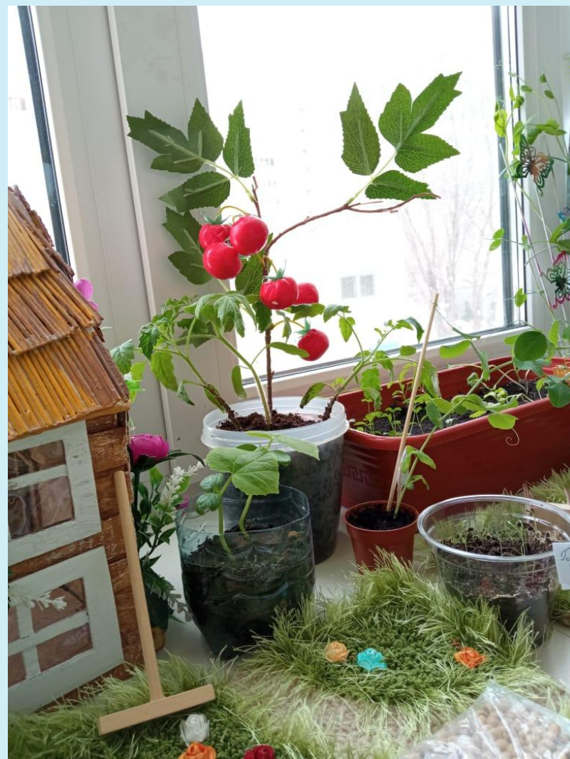
Тыква, помидор, морковь