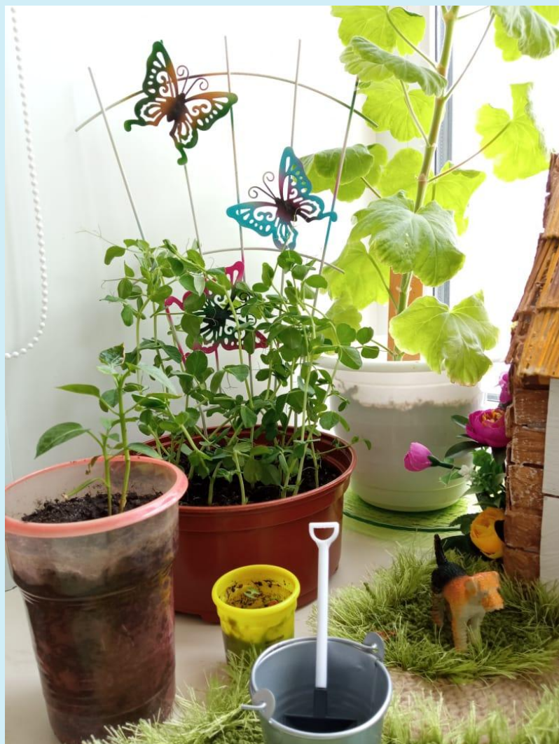
Перец и горох